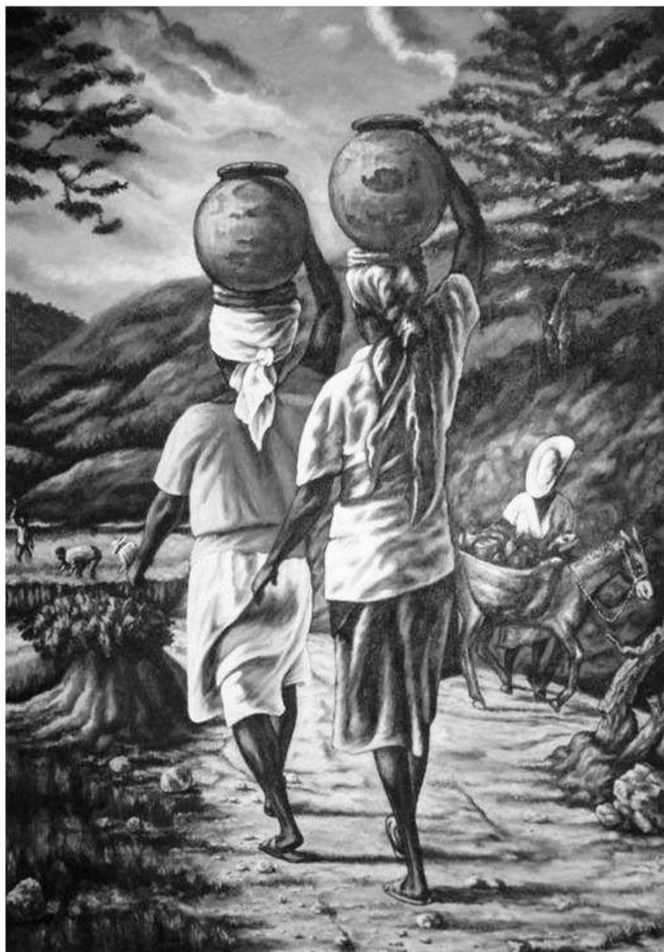
Rasin, Machann dlo , 2008

Or, lorsque l'investissement per capita ne couvre même plus la dépréciation du capital per capita existant, l'économie haïtienne se trouve dans une dynamique de déclin, c'est-à-dire qu'elle fait face à une logique régressive. Pour relever la situation, il faut des proportions plus élevées du surplus économique pour financer des capacités nouvelles de production, car quand l'investissement par tête dépasse le montant de la