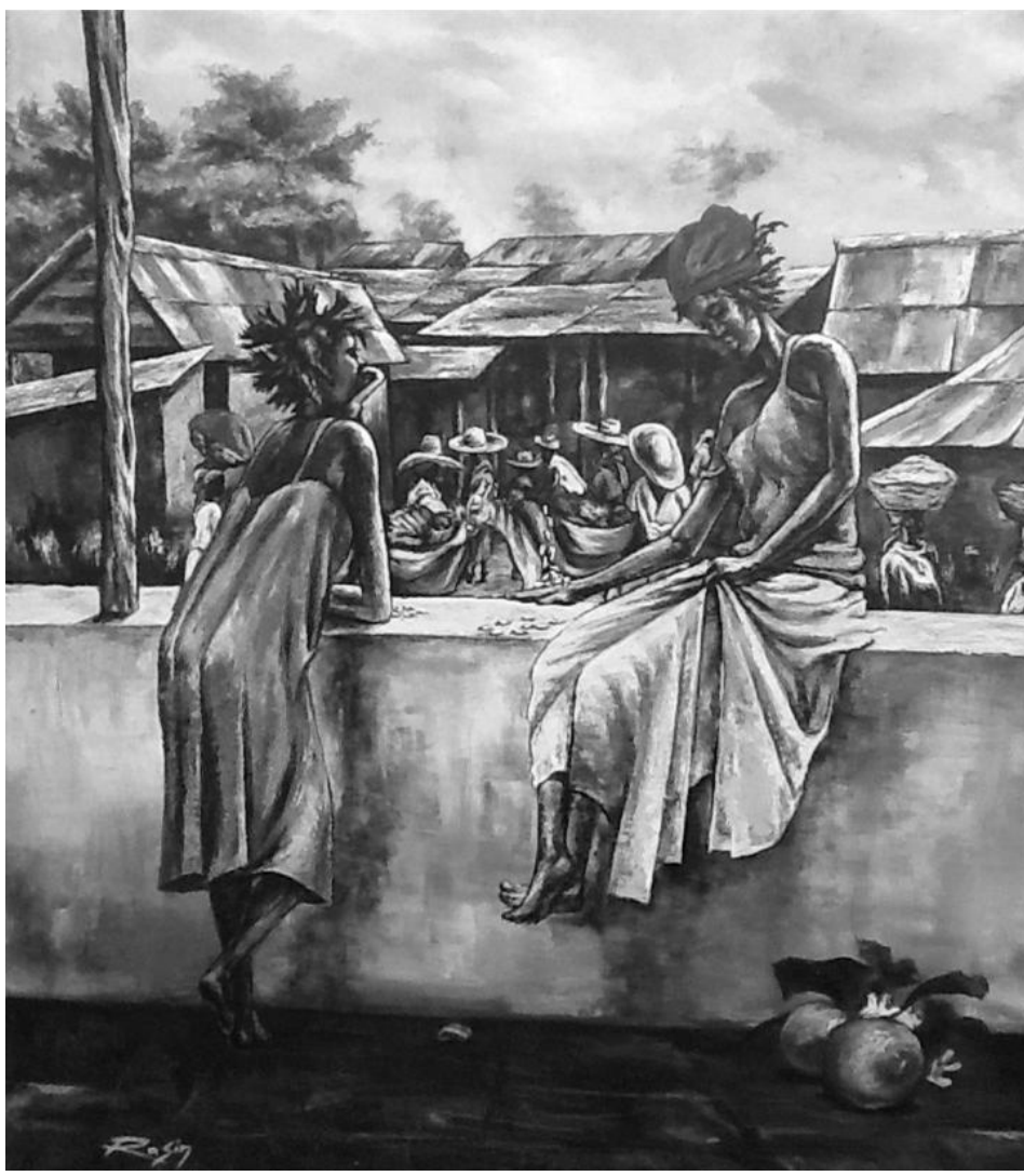
Rasin, Jwèt pèch , 2010

Cet article étale l'importance des femmes dans l'économie sociale et solidaire en Haïti, de données illustrant de manière significative la place qu'elles occupent dans l'industrie, l'agriculture et les services aussi bien au niveau social dans l'éducation et la prise en charge de leur famille. Un plaidoyer à visage humain pour réhabiliter la femme haïtienne rejetée dans la marginalisation, la prostitution, la domesticité et l'informel, et réclamer pour elle plus de justice sociale quant au droit à l'éducation et à la prise en charge.