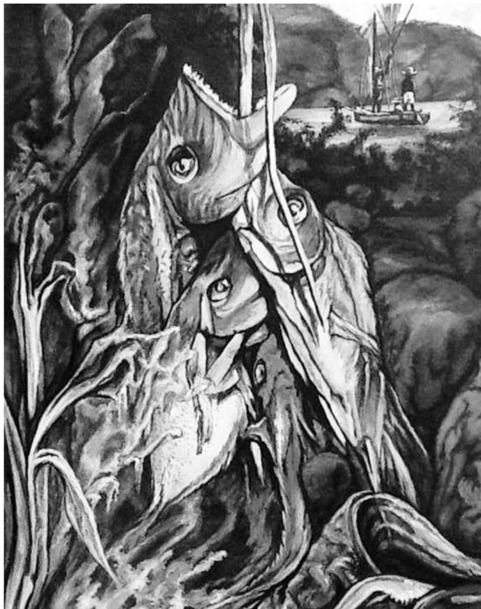
Rasin, Kòd pwason , 2013

Ces UPI auraient chacune un capital physique moyen estimé à 1250 dollars américains. Environ 36% de ces UPI appartiennent à des femmes. Près de 90% ont un proprié- tair-