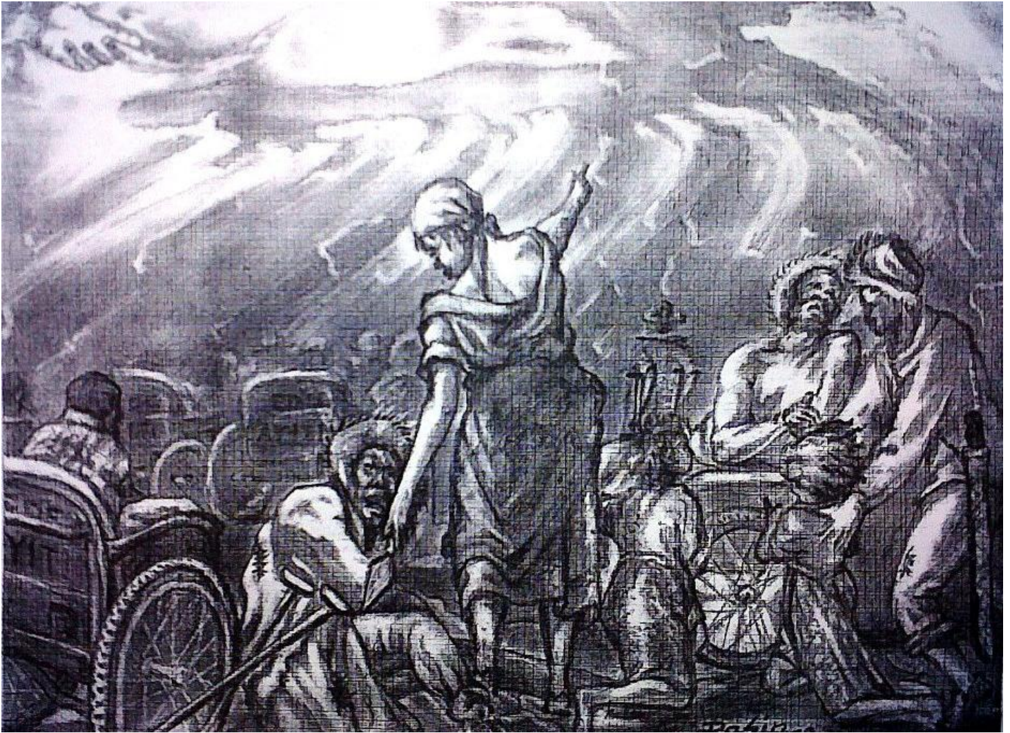
Rasin, Intégration des handicapés , 2010