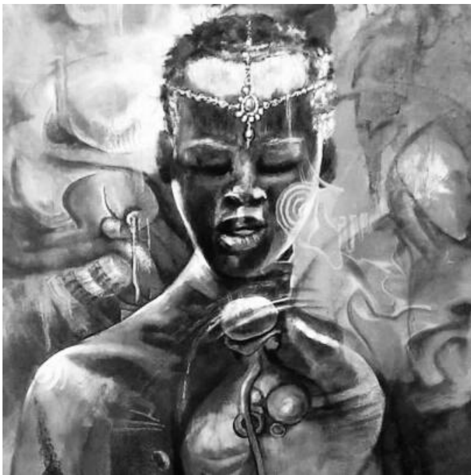
Rasin, Septième pierre , 2015