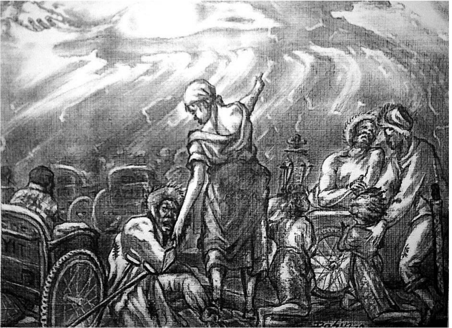
Rasin, Intégration des handicapés , 2010